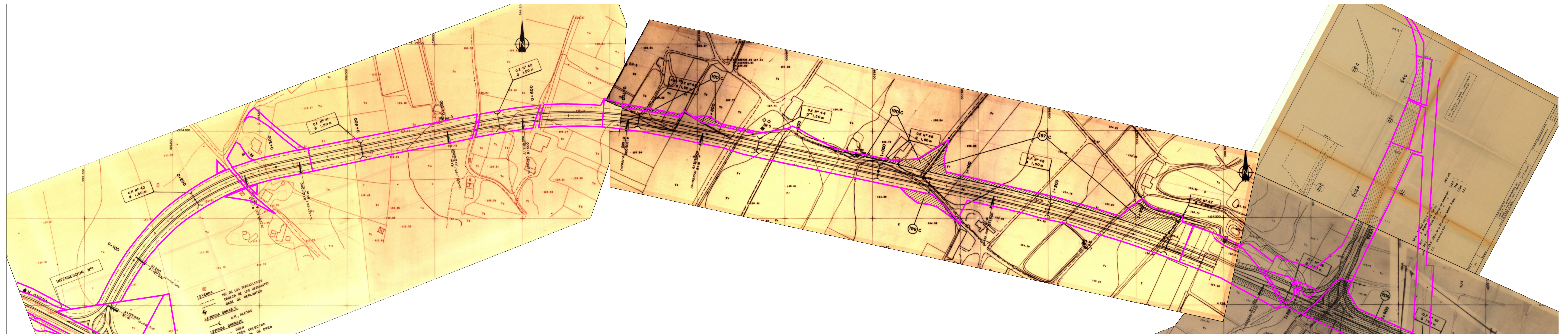
PLANO FACILITADO POR EL SERVICIO DE CARRETERAS DE LA DELEGACIÓN PROVINCIAL DE ALMERIA, EL 30-04-2009 EN EL QUE SE DEFINE EL LÍMITE EXPROPIACIÓN PARA LA EJECUCIÓN DE LA VARIANTE DE VERA.